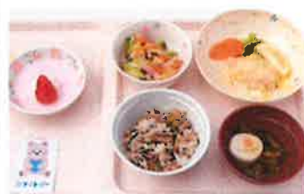
出来立て温かく美味しい お食事(体験時は無料です)