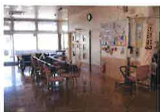
機能訓練室で楽しくリハビリいたしましょう